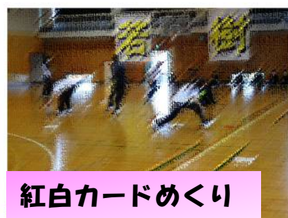
紅白カードめくり