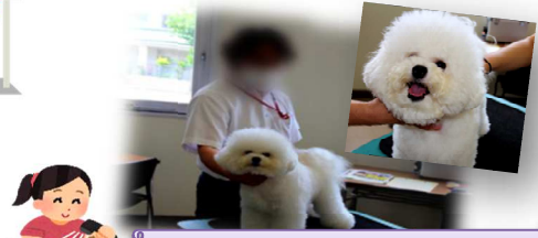
ワンちゃんのお手入れ体験