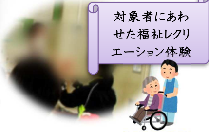
対象者に合わせた福祉レクリエーション体験