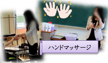
ハンドマッサージ