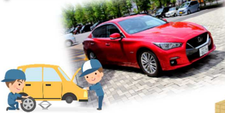
次世代自動車と最新の安全技術