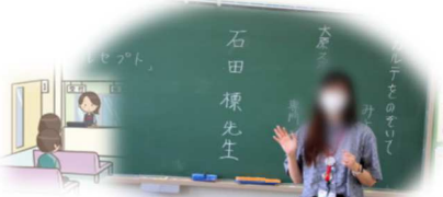
カルテをのぞいてみよう