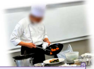
中国料理を通して調理の仕事を知ろう!