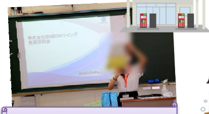
販売の仕事について