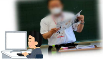
プログラミングの基礎を体験